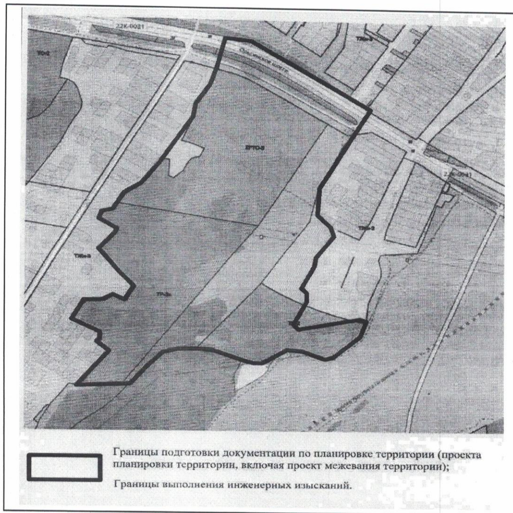
Схема границ подготовки инженерных изысканий

Проектор по административно-хозяйствен- работе С.И. Саян